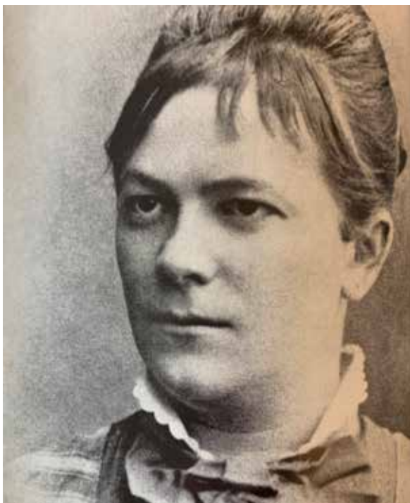
Clara als junges Mädchen, aus: Clara Zetkin. Leben und Wirken, Berlin 1979, unnummerierte Fotoseite zwischen den Seiten 48 und 49