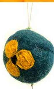
handmade by KHS