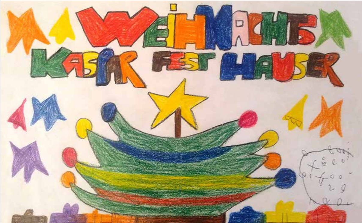
Zeichnung von Mario Vekic aus dem Beschäftigungs- und Förderbereich Kunst